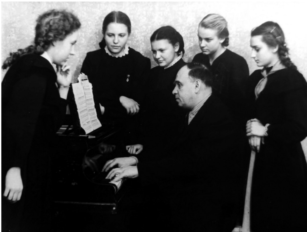
Ілюстрація № 5. Лев Вайнтрауб та учениці школи-десятирічки (в майбутньому її викладачки)

Виконавська діяльність в межах філармонії