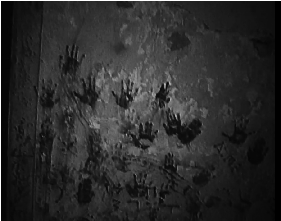
Іл. 8. Кадр з х/ф «Відьма з Блер: Курсова з того світу» (англ. "The Blair Witch Project")

У масовому кінематографі трапляються випадки, коли митці йдуть, навпаки, попри студійну систему для того, аби світ побачив саме авторський фільм, яким він був в уяві людини, яка керує творчим процесом, – режисера. Тут доречно знову розглянути приклад з Розширеним всесвітом DC. Режисер Зак Снайдер, який працював над першими двома кінострічками масштабного проєкту по коміксах: «Людина зі сталі» (англ. "Man of Steel") 2013 року та «Бетмен проти Супермена: На зорі справедливості» – був запрошений для створення кросовера «Ліга справедливості» (англ. "Justice League") з міжнародною прем'єрою 2017 року, у якому відбувається об'єднання багатьох персонажів з надздібностями проти ворожих сил. Після зміни політики кінокомпанії щодо розвитку фільмів про супергероїв сумні наслідки не оминули нову кінокартину й цього разу. Після постійного переписування сценарію і великої кількості від-