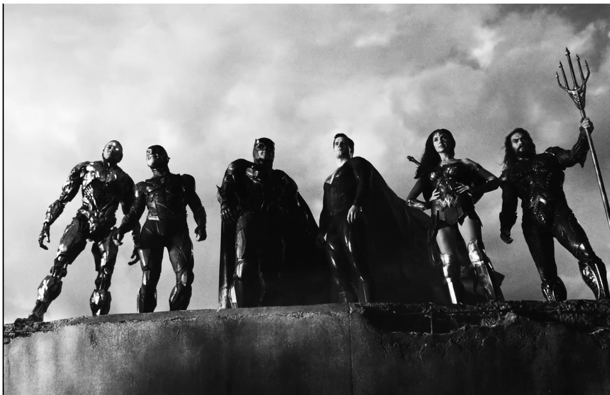
Іл. 7. Кадр з ф/м «Ліга справедливості Зака Снайдера» (англ. "Zack Snyder's Justice League")

картиною в межах Розширеного всесвіту DC (англ. DC Extended Universe). Початковий задум продюсерів масштабного проєкту полягав у створенні власної мережі аудіовізуальних кіноробіт, які будуть поєднані між собою сюжетом і персонажами, аналогічно до студії Marvel, проте порівняно з нею матимуть візуальний та емоційний контраст. Перші два фільми супергеройського кіновсесвіту наслідували першочерговому плану, проте, зрештою, було прийнято рішення продовжити рух у іншому творчому напрямі.