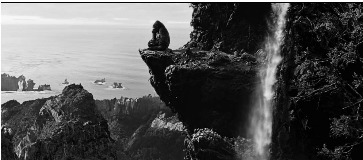
Лл. 4. Кадр з х/ф «Кінг-Конг» (англ. "King Kong")

можна зробити висновок, скільки фільмів ми в змозі зробити за один рік» (Elberse, 2013, p. 1).