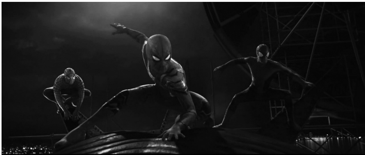
Іл. 2. Кадр з х/ф «Людина-павук: Додому шляху нема» (англ. "Spider-Man: No Way Home")

ями часу, з'ясувати актуальність створення та презентації цих кінопроектів для глядачів усього світу впродовж багатьох десятиліть. Тому можемо зазначити, що головною метою статті є репрезентація блокбастеру як провідного аудіовізуального твору сучасної масової культури.