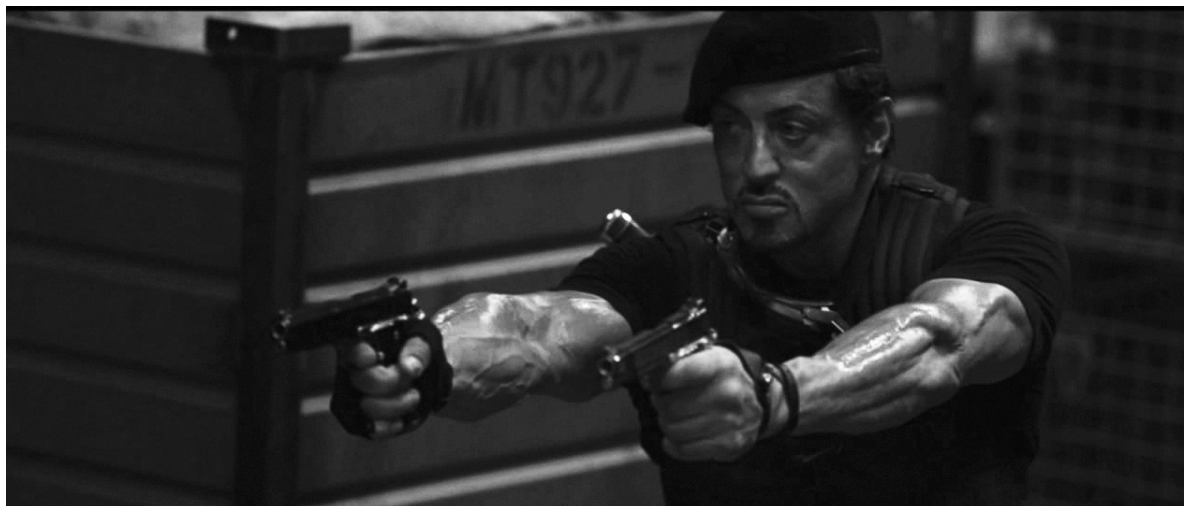
Іл. 1. Кадр з х/ф «Нестримні» (англ. "The Expendables")

глядацької аудиторії, аби мати змогу задовольнити смаки поціновувачів аудіовізуального мистецтва й отримати належний зворотній зв'язок від них у вигляді фінансового доходу. Найкращим рішенням для виконання намічених цілей щодо захоплення масової аудиторії є саме блокбастери, які мають давню історію, постійно трансформуються, здатні бути цікавими для різного віку споживачів, навіть для різних поколінь. Дослідження теми є досить важливим фактором не лише для розуміння природи функціонування глобального кінематографу, а й для розкриття нової аудіовізуальної культури, що має необмежені можливості для реалізації найсміливіших ідей та навіть нових форм сприйняття реальності.