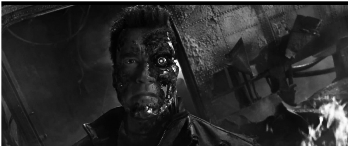
Іл. 3. Кадр з х/ф «Термінатор 3: Повстання машин» (англ. "Terminator 3: Rise of the Machines")

студії. Відмінність між мейнстрімним кіно (англ. "mainstream" – основна течія), яке презентує собою видовище для великої кількості глядачів, та арт-хаусом (авторське кіно), розрахованим на вузьке коло поціновувачів цього напрямку, простежується саме в питанні фінансової складової.