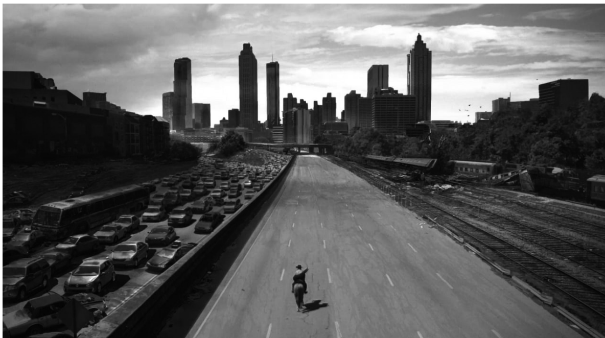
Іл. 5. Кадр з т/с «Ходячі мерці» (англ. "The Walking Dead")

творці фільму вирішили затягнути глядача в кіно-театр знайомими дійовими особами та акторами, які точно не залишать байдужими фанатів супергероя. До останнього моменту не було офіційно проінформовано прихильників, чи повернуться на екрани персонажі у виконанні Тобі Магвайра та Ендрю Гарфілда, хоча й з'явилися повідомлення про їхню можливу появу. Лише трейлер фільму, який вийшов за декілька місяців до прем'єри кінокартини, розкрив певні деталі того, що творчий колектив підготував для глядачів. Результатом цього став великий попит на передпродажні квитки в США та перше місце в рейтингу найкасовіших кіноробіт за 2021 рік, що стало великим досягненням для світової кіноіндустрії в період пандемії COVID-19 (Box Office Mojo, а).