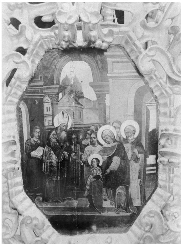
Ил. 11. Введення до храму. 1916 р.