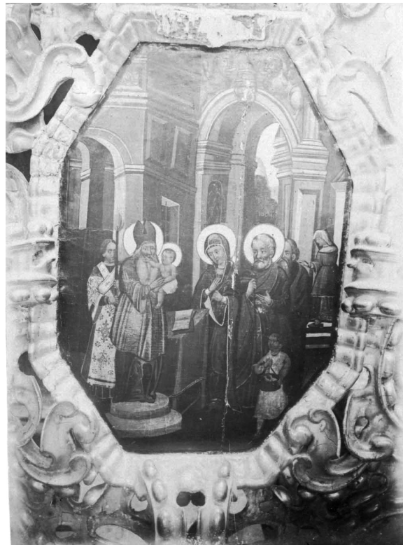
Іл. 8. Стрітєння Господне. 1916 р.

На сьогодні, як видно на фотографії, пророчий ряд цілком відсутній, а фрагмент його представлено Богородицею, що збереглася, хоча й у переписаному вигляді, і посідає центральне місце, а по обидва боки якої дві ікони з зображенням святих. Із цих чотирьох ярусів, згідно з «кошторисом», як і тепер — очевидно намісний і апостольський яруси були колонні, по 14 колон у кожному. Верх іконостаसा не обривався, як зараз, а «сверх оных (тобто чотирьох ярусів ікон) разныя украшения» були, як це спостерігаємо в інших сучасних пам'ятках. Які саме це були прикраси, сказати тепер складно, але, імовірно, це були різні ажурні рами довкола ікон із зображенням пророків, подібні до тієї, яка нині облямовує збережену в цілісності ікону Богоматері. А нагорі іконостаса було «Розп'яття з предстоячими». Тепер від нього залишилися тільки підтримувальні їх три ніжки, з яких на середній встановлено простий хрест. Усіх же «великих і малих ікон (в іконостасі) 85»... У теперішній час їх тільки 56. А якщо не брати до уваги дві ікони із зображенням святих, що не мали раніше жодного місця в іконостасі, то залишиться тільки 54.