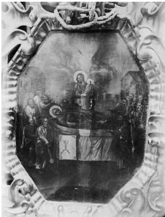
Іл. 15. Успіння Богоматері. Фото С. Таранушенка. 1916 р.