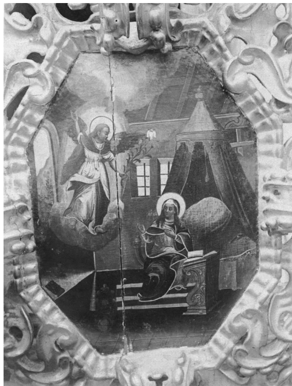
Лл. 18. Благовіщення. 1916 р.

В архіві монастиря зберігається опис 1870 р., списаний з опису 1860 р., але з поправками, за якими ми можемо судити, що постраждало від пожежі в іконостасі. А постраждало насамперед те, що не мало постраждати — срібло й коштовності, які прикрашали ікони, водночас самі ікони залишили-