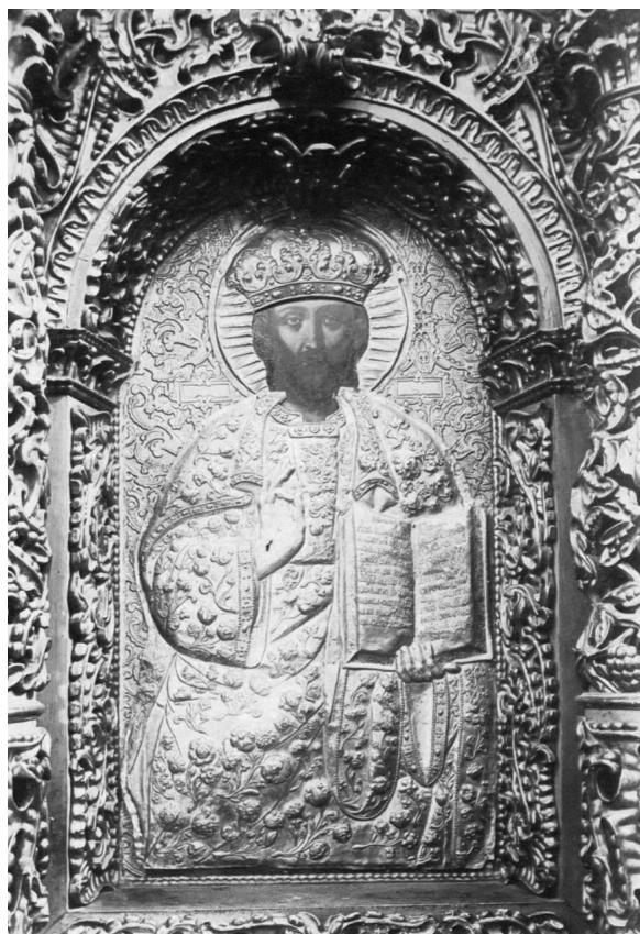
Іл. 1. Христос Вседержитель (у срібних шатах). 1916 р.