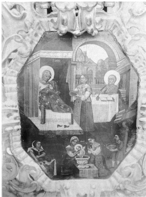
Іл. 7. Різдво Богородиці. 1916 р.