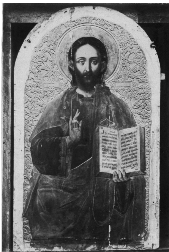
Іл. 2. Христос Вседержитель (без шат). 1916 р.

У верхніх двох зображено Благовіщення: архангел зліва, а Марія — справа; в інших чотирьох медальйонах розміщено чотири поколінні фігури євангелістів без символів. Написи в усіх медальйонах відсутні. Фон гладенький, золотий. Усі зображення на царських вратах, як і всі інші старі образи іконостаса, виконано темперною технікою 1 по левкасу.