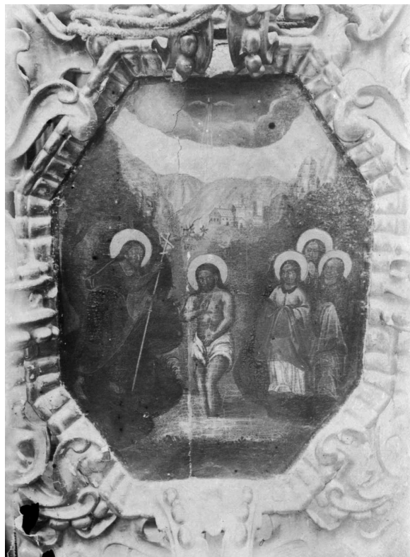
Іл. 14. Богоявлення (Хрещення). 1916 р.

ням трьох пророків». «Далі несення хреста Спасителем, поряд з нею [ікона] трьох пророків». Що було по ліву сторону Богородиці, в описі не зазначене. Тут, очевидно, треба припускати помилковий пропуск, адже неможливо уявити, щоб іконостас мав, з одного боку, «3 яруси», а з іншого, тільки два. Можна тільки здогадуватися, що й там була така сама кількість ікон з аналогічними зображеннями. З наведених останніх слів опису робимо висновок, що в цьому ряду були ще залишки старовини — ікони з зображенням пророків, але вже були нові сюжети — страсті та зображення святих, і, наскільки можливо зауважити з опису, з кожного боку було вже не по 6, а по 4 ікони й не з одноосібними зображеннями (як можна очікувати з огляду на ті обставини, що 1) іконостас був великих розмірів завширшки і заввишки, 2) місця для ікон було достатньо, 3) недостачі в коштах також не було), а з багатоосібними. Усе це разом узятє дає підстави вважати, що пророчному ярусу першому довелося стати жертвою поновлювачів. І на місці 12 окремих дощок з одиничними зображеннями пророків для здешевлення постав-