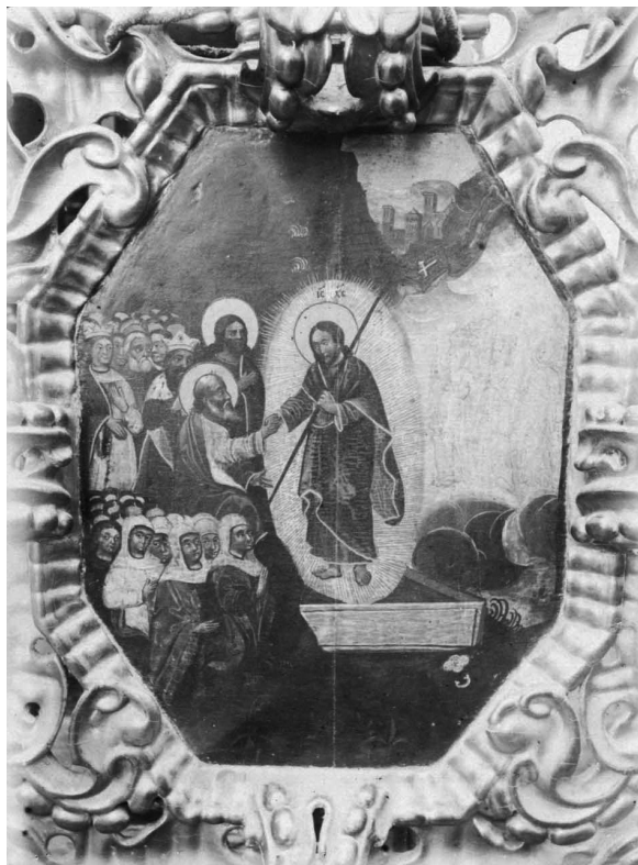
Іл. 13. Воскресіння Христове. 1916 р.