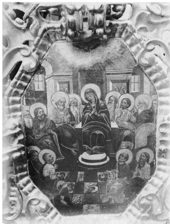
Іл. 16. Ікона Зішестя Св. Духа

тольському, і апостолів, і святих характерне для цілої низки пам'яток.