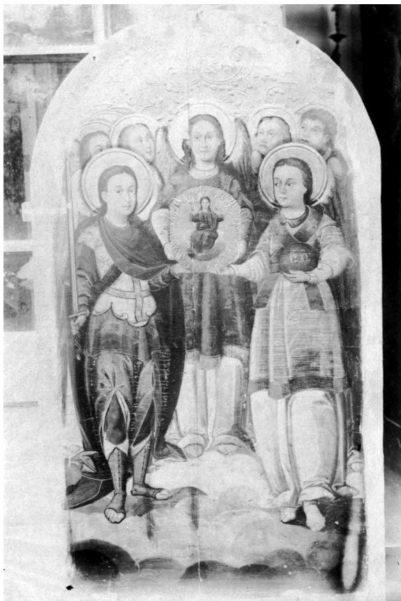
Іл. 3. Собор Архангела Михаїла. 1916 р.