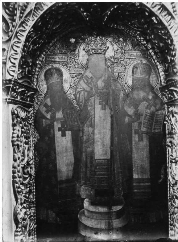
Іл. 6. Три святителі. 1916 р.

Цей ярус є найбільш збереженим у всьому іконостасі, за винятком ікони Успіння, яку цілковито записано, решта добре збереглися, тільки на деяких дошки розійшлися і дали тріщину. Усі ікони майстерного виконання, фон усюди гладенький, золотий, багато з них містять розкішні архітектурні пейзажі та складні композиції 11 .