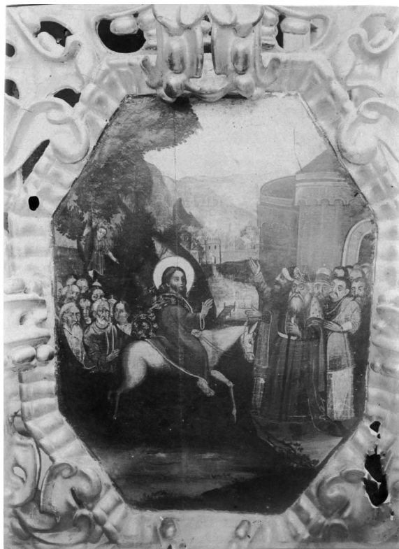
Іл. 10. Вхід у Єрусалим. 1916 р.

Архімандрит Агапіт просив у Св. Синоду на ремонт 129 947 рублів, але Синод відпустив тільки 30 000 руб. Ремонт виконував його наступник, архімандрит Іустин (1834–1840) і, з огляду на недостатні кошти, увесь іконостас не було оновлено, але верхніх частин, треба гадати, ремонт усе-таки торкнувся і, хоча в архіві монастиря не знайшлося підтверджувальних щодо цього припущення документів, таке необхідно припустити, з одного боку, тому, що ні в архіві, ні в друкованих джерелах немає жодних вказівок на ремонт Успенського храму та іконостаса в проміжках 1833–1860 рр., а з іншого — тому що в опису 1860 р., як це нижче буде видно, спостерігаємо відступи від схеми, вказаної «Кошторисом». Ці відступи стосуються тіль-