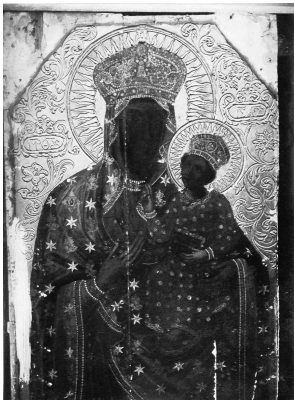
Іл. 5. Богоматері з Немовлям (без шат). 1916 р.