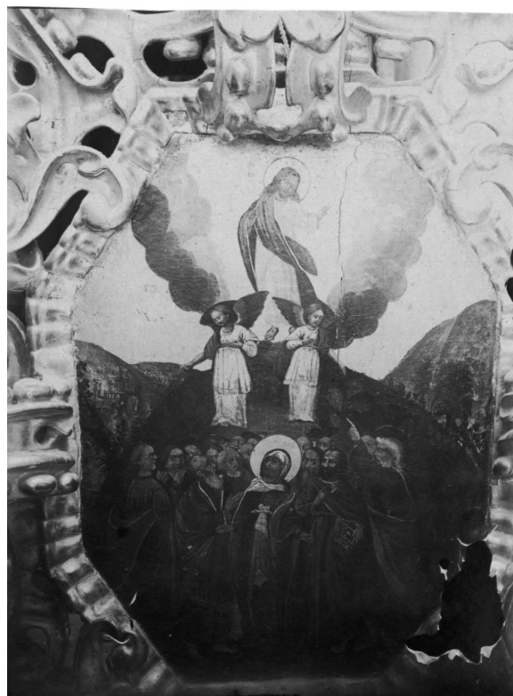
Ил. 12. Вознесіння Господнє. 1916 р.

«Намісні ікони: справа царських врат — Спасителя, зліва — Богоматері».