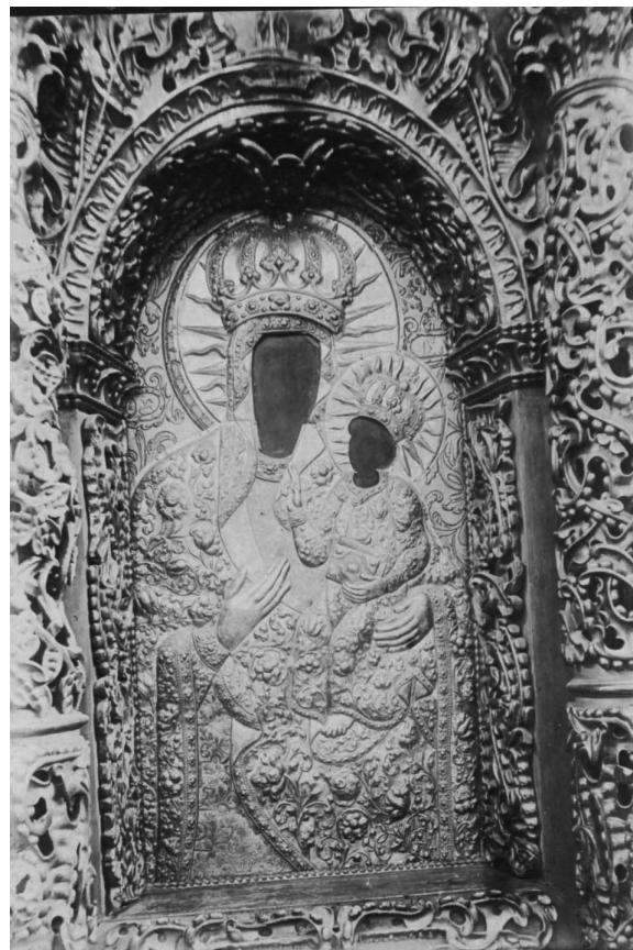
Іл. 4. Богоматері з Немовлям (у срібних шатах). 1916 р.

відповідну форму рами-ніші в іконостасі, тоді як на інших старих іконах нашого іконостаса верхній край рельєфного фону завершується півколом.