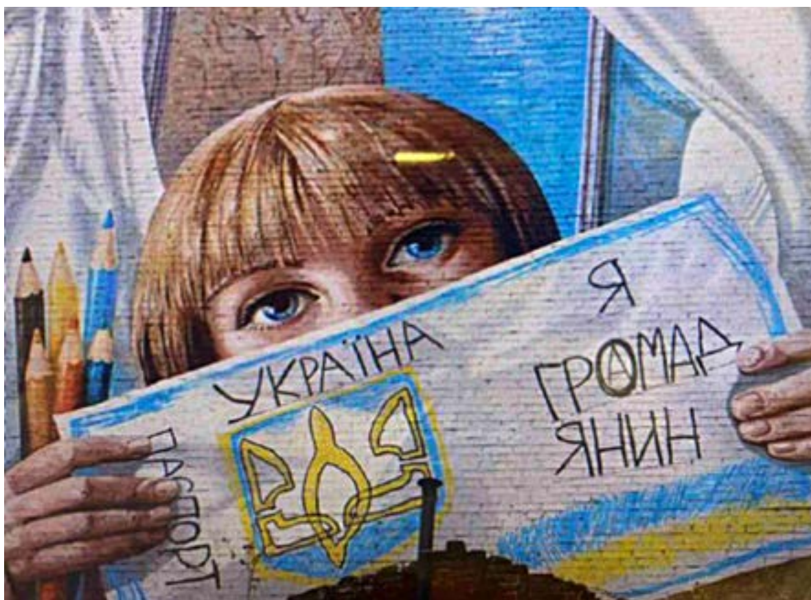
Іл. 9. Мурал «Маленький громадянин» у Києві. Катерина Рудакова. 2019.