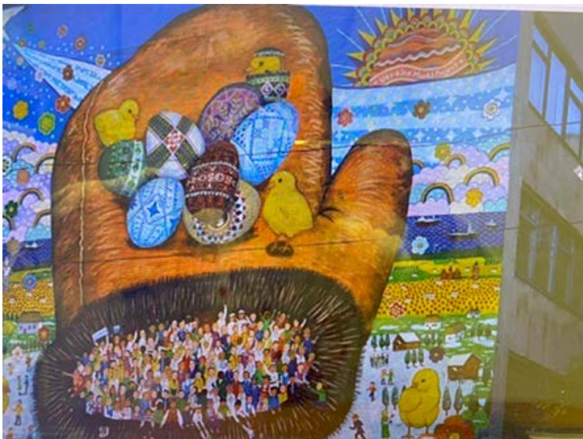
Іл. 5. Мурал «Рукавичка» у Маріуполі. М'язакі Кенске з українськими дітьми. 2017.

потреба створення/відновлення відповідного графіті-продукту.