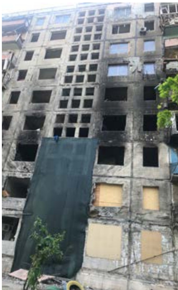
Іл. 14. Відновлювальні роботи в зруйнованому будинку на Оболоні. Травень 2022.

во — музики в малярство, бо особистість Скрябіна непересічна — людина творча з вірою у свою націю. Зрозуміло, що зображення такого формату продовжило справу співака-патріота, почало виконувати культуротворчу націєзберігаючу функцію. Слова Кузьми-особистості не можна ні спростувати, ні доповнити: