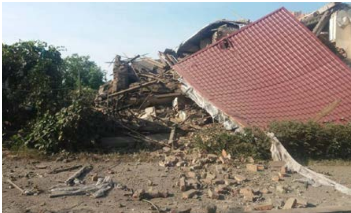
Іл. 4. Зруйнований ракетою будинок на Закарпатті. Травень 2022.