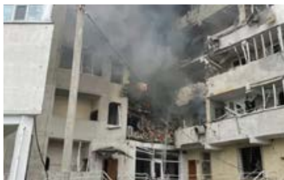
Іл. 18. Одеса. Травень 2022.

«Я сподіваюся, що люди, які дивляться на цю картину, і які дивитимуться на неї з усього світу, молитимуться про мир в Україні. Цей мурал — символ добрих відносин України та Японії», — зазначив Коджі Тсутсуї, перший секретар Посольства Японії в Україні (На школі у Маріуполі, 2017).