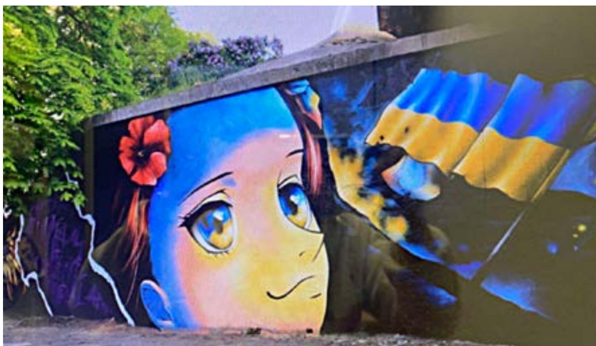
Іл. 10. Мурал «Дівчина з маком» у Києві. Paint Hunters. Травень 2022.