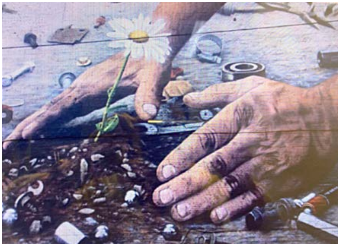
Іл. 8. Мурал «Rise up in the dirt» — «Піднятися з бруду» у Києві. ВКFoxx. 2017.

Наповнення культурного простору міст, містечок та селищ України змістовними настінними зображеннями стало звичним, не викликало подиву. Практично кожен пересічний українець перетинав міський простір як великий музей просто неба, що повсякчас поповнювався новими «експонатами». Звісно, що будь-яка свіжа робота збурювала емоцію захоплення, супротиву, можливо, відризи. Позитивним у розвиткові, розширенні, популярності такого мистецького руху «до» було привнесення нових знань споглядачеві за-