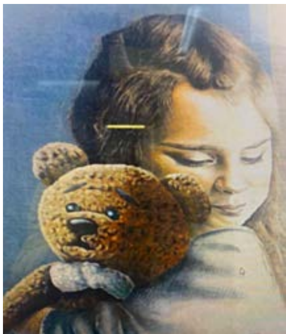
Іл. 7. Мурал «Мілана» в Маріуполі. Саша Корбан. 2018.

збережені/новостворені об'єкти масової уваги в різних містах багатостраждальної держави, надати можливість порівняти «до» і «після». Дослідити діапазон розповсюдження/збереження/сплюндрування націєтворчих муралів-образів в українському урбанпросторі. Провести аналогії, що допоможуть затвердити ставлення до стріт-арту (саме зважаючи на військовий час та руйнування, що він несе) як до культурного осередку, що спрямовує до культурно-морального збагачення.