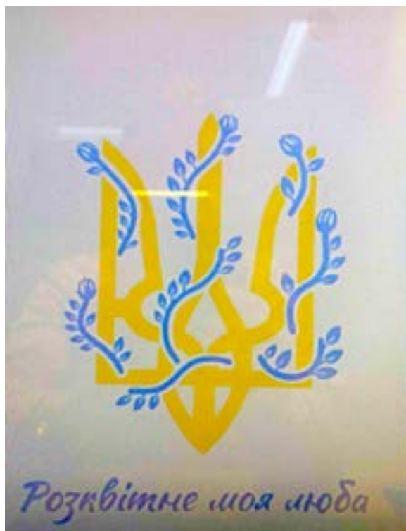
Іл. 21. Графіті «Розквітне моя люба». Запоріжжя. Травень 2022.

для всіх знедолених через війну. Будуть полотна — будуть нові мурали, аби були люди.