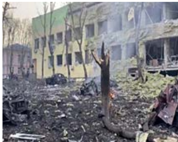
Іл. 6. Зруйнована школа мистецтв у Маріуполі. Березень 2022.

траграфітіної імплементації світлообразу України на тлі війни в міському культурному фоні через візуальне втілення на збережених/відновлених стінах-полотнах масовому споглядачеві, вирізнити