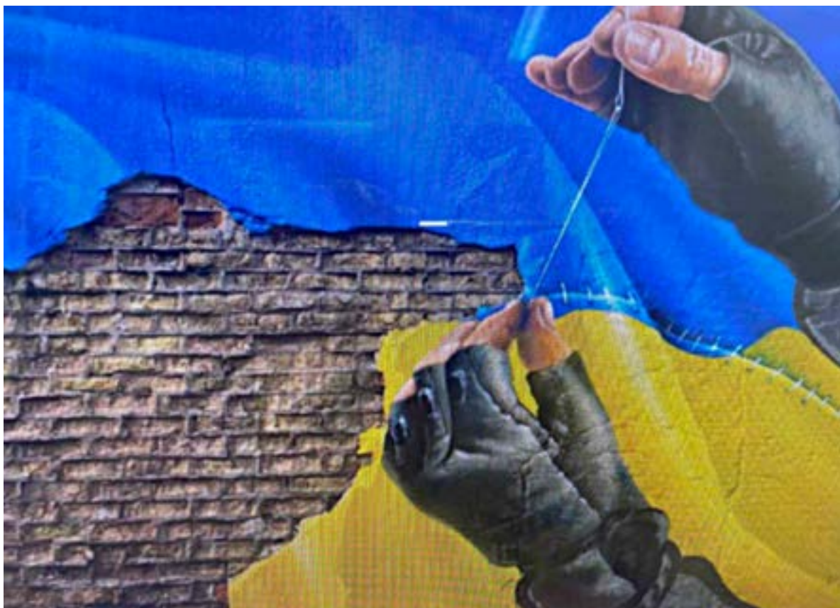
Іл. 12. Мурал «Солдат зашиває прапор» у Києві на Оболоні. Саша Корбан. Березень 2022.

авторства не дає змоги назвати імена райтерів-воїнів, але за останніми тенденціями художники почали творити відкрито, з гордістю за свою країну, народ-націю.