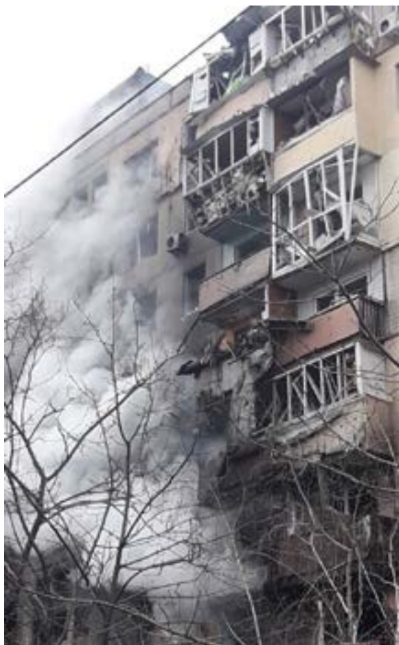
Іл. 13. Будинок на Оболоні після влучання рашистського снаряда. Березень 2022.