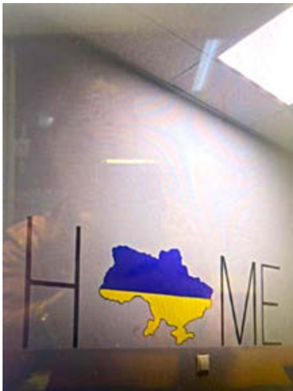
Іл. 24. Графіті «Ноте». Запоріжжя. Травень 2022.