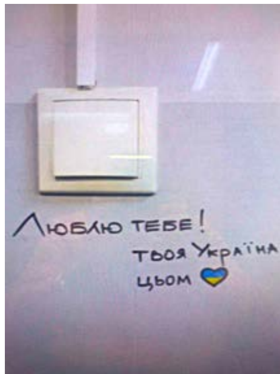
Іл. 23. Графіті «Люблю тебе!» Запоріжжя. Травень 2022.