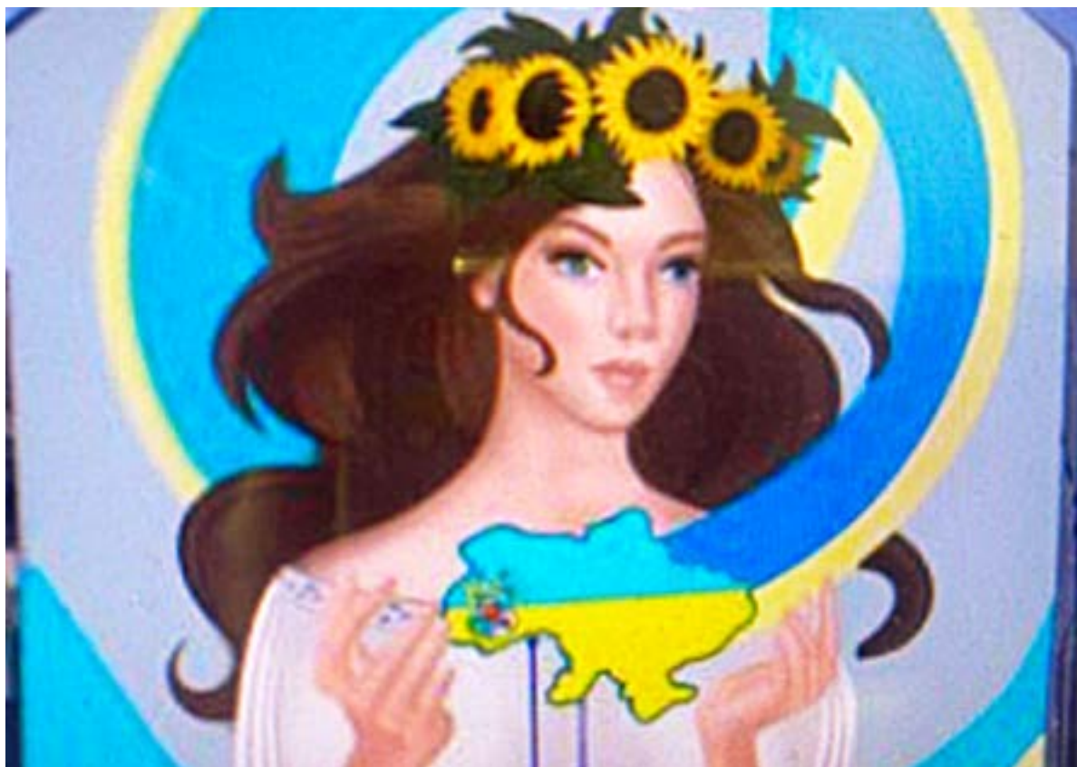
Іл. 3. Мурал «Дівчина «тримає» Україну в руках» у Виноградіві. Анастасія Худякова. Березень 2022.