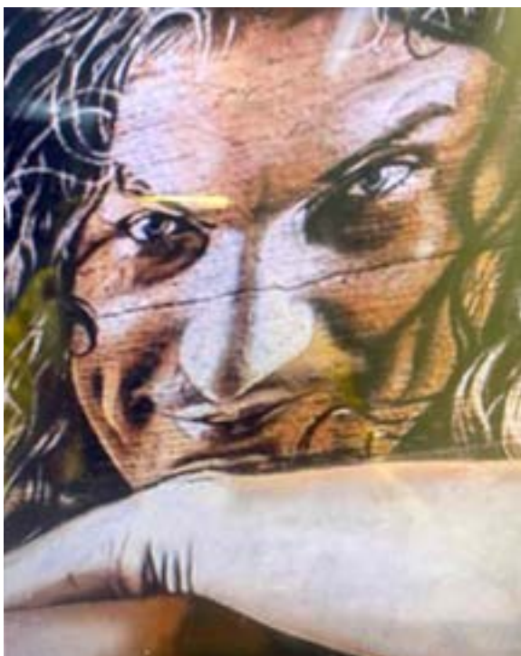
Гл. 1. Мурал «Скрябін» у Харкові. Творча група харківських митців «Kailas-V». 2018.

наносяться на згасаючі привиди минулого графіті та зруйновані поверхні міста.