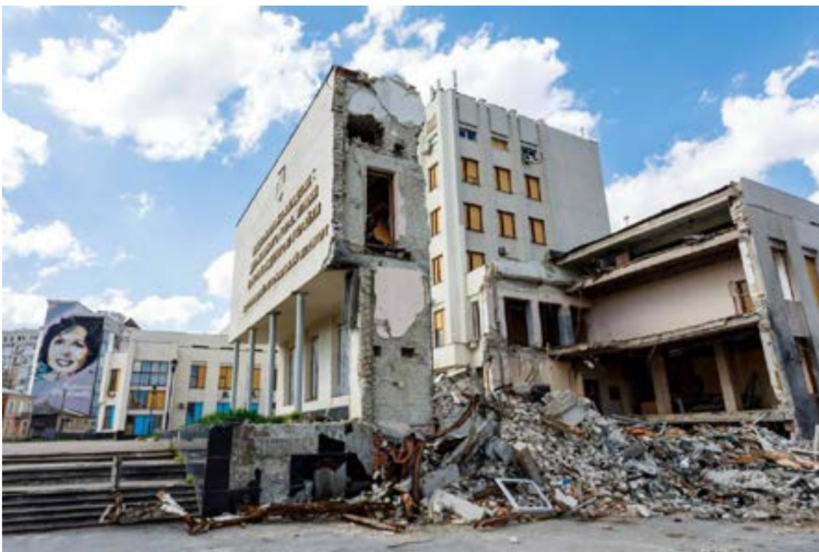
Гл. 2. Харків. Квітень 2022.

Ефемерні за своєю природою графіті — це вид мистецтва, який святкує зміни та живиться новими ідеями. Коли художники розгортають свої твори, настінні простори стають місцем розмноження нових форм, технік і тактик (Mathieson, & Tapies, 2009). Міський простір «до» заповнився написами, малюнками з глибоким наповненням та художньою цінністю. Графіті/мурали можна трактувати як незалежний комунікативний канал публічного простору (Станіславська, 2016, с. 127). Особливої уваги заслуговують полотна зі змістом, адже вони несуть у маси не лише інформацію — створюють картини мирного життя, стверджують невідворотність повернення до звичного людського щастя. Наразі визріла потреба зробити розвідку щодо відображення на стінах-полотнах «до» і «після», що, на думку автора, відкриває нове розуміння для споглядача завдяки імплементації візуального через національну ідентичність на відкритих міських полотнах. Запит на збереження культурного простору як показника мирного життя зростає, тому виникає