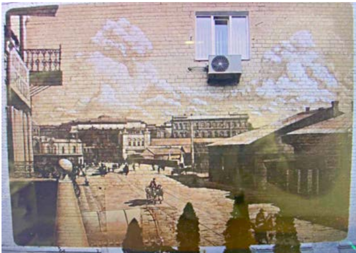
Іл. 15. Мурал «Стара Юзівка» в Донецьку. Творче об'єднання «Добрі люди». 2012.

продовжила мистецький волонтерський спротив: у містечку Виноградіві коштом мисткині виник новий націєствердний мурал. Культурний рух не згасає під час війни — він розгорається з неймовірною силою. Під обстрілами дівчина займалася криптоартом, тобто створювала діджитал-роботи в межах благодійних аукціонів, так допомагала українській армії; зараз на більш безпечній локації охоплена масштабним задумом — створенням муралу, щоб підтримати дух українського народу, віру в нашу армію. До речі, саме цей мурал став першим в Україні після повномасштабного вторгнення. На полотні постала дівчина, яка «тримає» в руках Україну (іл. 3).