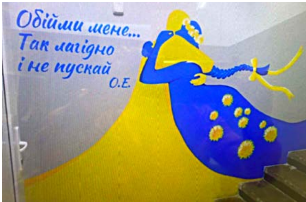
Іл. 22. Графіті «Обійми мене...». Запоріжжя. Травень 2022.

Київ. 2017 року на будівлі управління поліції Печерського району Києва виникло нове зображення: людина допомагає квітці прорости крізь мотлох та бруд. Мурал має назву «Rise up in the dirt» — «Піднятися з бруду» (іл. 8). Робота створена райтеркою з Нью-Йорка ВКFoxh. Художниця прагне до яскравих потужних витворів, щоб спонукати споглядачів до роздумів. Абсолютно логічною була задумка авторки щодо розміщення муралу на офіційній установі, що основним своїм функціоналом має захищати будь-яке життя. Крім того, обов'язково спрацює імплементація візуального заради утвердження добра та миру, хоча райтерка тяжіє до думки про тимчасовість мистецьких витворів. На місці руйнацій будуть виростати нові й нові. Ідеєю до створення полотна слугували слова з пісні гурту «Voxtrot» «Rise Up in the Dirt» («Підвестися з бруду»): «Я можу бути квіткою, піднятися із бруду» («англ. I can be a flower, rise up in the dirt»). Знову мистецтво постає перед нами в діалозі, і це розмова трьох — пісня–мурал–людина. За