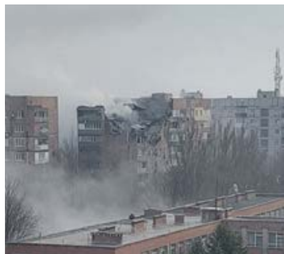
Іл. 16. Донецьк. Березень 2022.

Вибух у селі Велика Бакта на Закарпатті про-