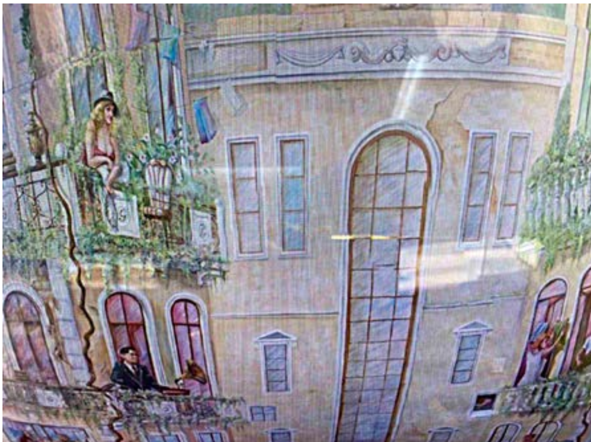
Іл. 17. Мурал Zheneva Art Wall у Одесі. П'ятеро одеситів. 2014.

лунав на початку травня цього року (іл. 4). Зруйнований будинок, на якому ніколи не виникне мурал, але не втрачена віра у відновлення не лише стін, а й нових культурних надбань митців «країни-фенікс».